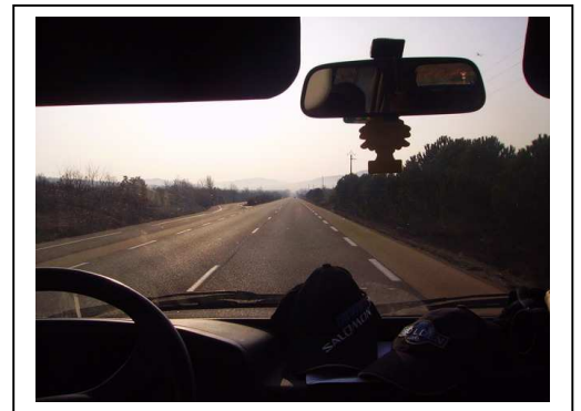
Longue, longue, longue.....

Oh ça va.....c'est la seule ligne droite de la région, j'peux en parler un peut, non ?